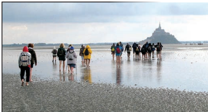
Il est encore loin, l'archange ?