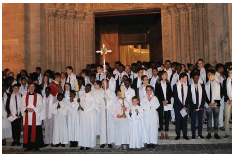
Confirmations à la Collégiale de Mantes-la-Jolie, 15 octobre 2016.