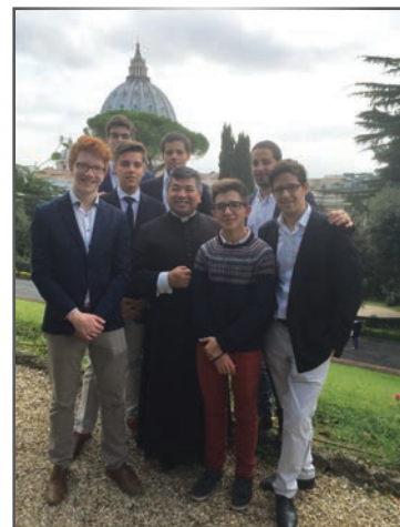
Qui sera le futur pape ?