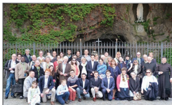
Au Vatican, privilège d'une prière devant la reproduction de la grotte de Lourdes.

A Rome, les pèlerins ont pu passer les 4 portes saintes des principales églises de la ville, Saint-Jean de Latran, Sainte-Marie Majeure, Saint-Pierre, et Saint-Paul-hors-les-Murs, ouvertes en cette année de la miséricorde.