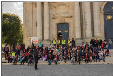
Les paroissiens de Limay-Vexin, heureux pèlerins de la miséricorde.