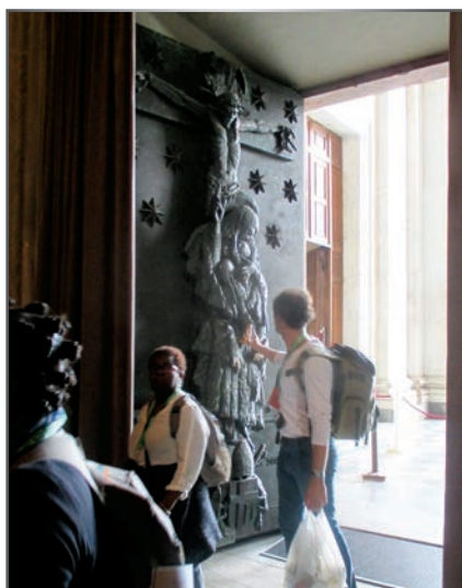
Le passage de la porte sainte de Saint-Jean de Latran.

Les différents itinéraires que peuvent emprunter les pèlerins sont balisés.