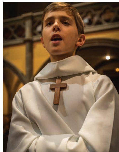
Le saviez-vous ? Les Petits Chanteurs à la Croix de Bois célèbrent en 2017 leur 110 ème anniversaire.

« C hanter, c'est prier deux fois ! » Que nous dit cette affirmation ? Faut-il avoir le cœur en fête pour chanter ? Les musicothérapeutes, intervenant auprès de personnes malades, nous apprennent : « Le chant permet d'aller plus profond ; il mêle respiration, rythme, mélodie, paroles et émotions. Chanter permet de mieux respirer, prendre appui sur son corps, stimuler ses neurones. » Alors, si la prière était une chanson ? Oui, il y aurait tous ces effets bénéfiques pour le corps, et pourquoi pas aussi pour l'âme aussi ? Chanter Dieu nous incite à l'écoute, à l'expression en mots de notre joie, de la louange, des remerciements, des cris de souffrance et de révolte aussi. On passerait du temps gratuit avec Dieu. Les mots des auteurs des chants deviendraient les nôtres : des mots échangés avec Dieu comme avec un ami sûr qui nous connaît et nous sauve. Notre prière chantée rejoindrait la lignée de milliers de Croyants d'hier et d'aujourd'hui qui disent leur confiance en Dieu. Prière responsable, pour lui parler de nos frères et sœurs démunis et opprimés comme l'ont fait Moïse ou Esther ? Prière solidaire, pour faire reculer le mal et la souffrance sur la terre humaine. Prière en Église, qui nous transforme peu à peu, ensemble, pour voir le monde à la façon de Dieu, source de Vie. Si les bienfaits en sont si grands, pourquoi s'en priver ? ▲