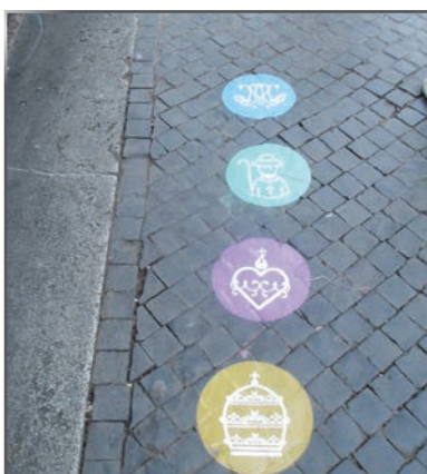
Le labyrinthe romain.

Ce serait dommage de ne pas s'arrêter quelques instants pour savourer une des fameuses glaces italiennes. Mmm... elles sont délicieuses !