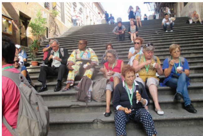
La pause dégustation.

Les voyages déforment les sacs à dos mais remplissent les Mantais de grâces, lors des récents pèlerinages.