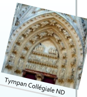
Tympan Collégiale ND