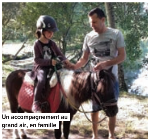
Un accompagnement au grand air, en famille

Depuis quelques années, le Secours catholique s'est restructuré à Mantes. Nous avons demandé aux bénévoles de nous dire ce qu'ils font.