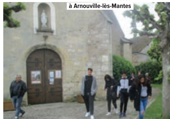
Sortie de messe à Arnouville-lès-Mantes

regroupement sera aussi l'occasion de renforcer les liens avec la commune de Guerville, toute proche, qui était venue, elle-aussi se joindre à Mantes-sud, il y a quelques années. La fusion s'était alors faite à son rythme, sans brusquerie, en tenant compte des apports de chacune des paroisses, qui ont fait preuve de leurs qualités d'adaptation. Finalement Mantes-sud s'en est retrouvé renforcé. Un nouveau défi à relever pour le futur groupement. ●