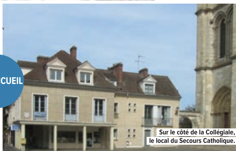
Sur le côté de la Collégiale, le local du Secours Catholique.