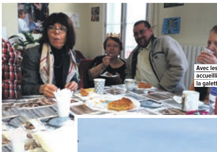
Avec les personnes accueillies, la galette des Rois.