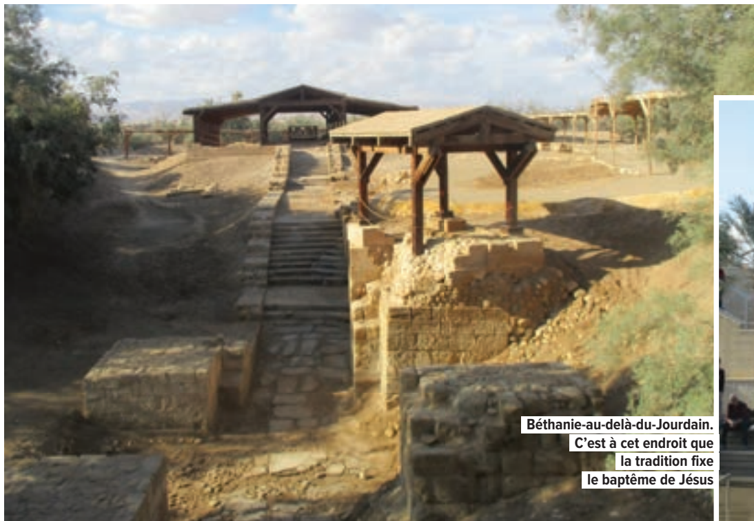
Béthanie-au-delà-du-Jourdain. C'est à cet endroit que la tradition fixe le baptême de Jésus