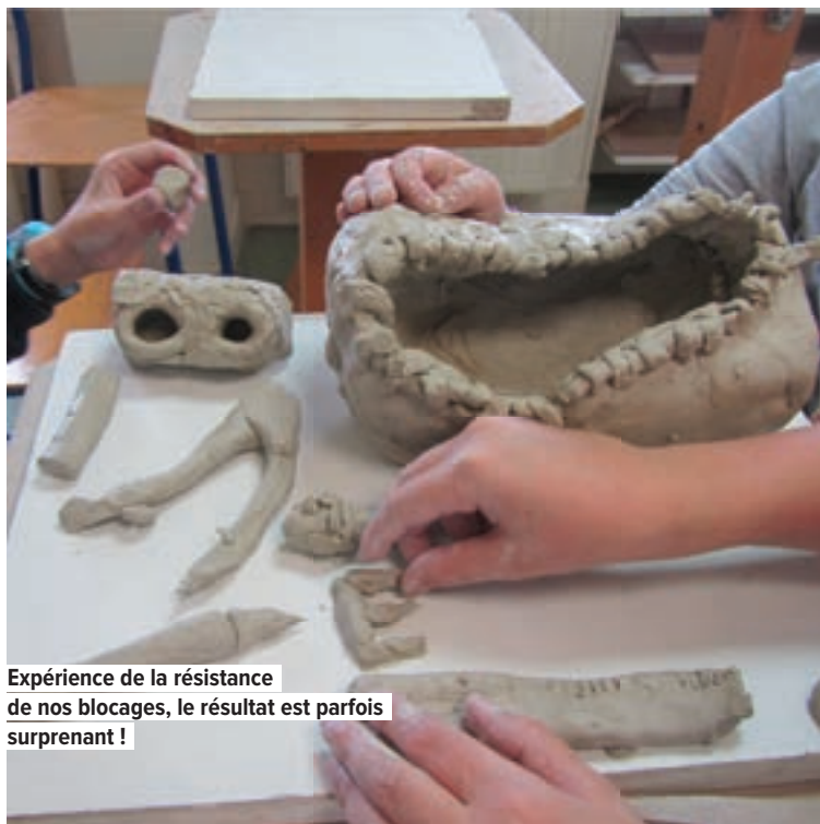
Expérience de la résistance de nos blocages, le résultat est parfois surprenant !

A 66 ans, retirée de l'enseignement, elle continue quelques travaux littéraires. Mais, comme elle le dit, c'est l'heure des choix. Si elle reste très attachée à la réalité locale de Mantes, elle veut aussi se donner du temps pour voyager. ●