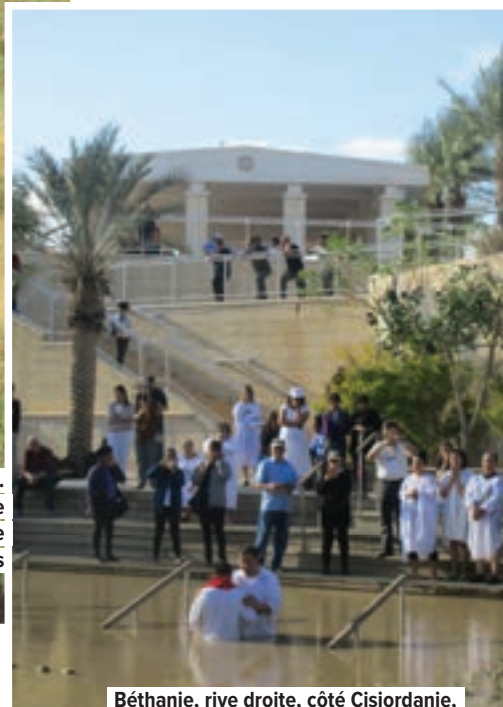
Béthanie, rive droite, côté Cisjordanie, en territoires occupés : un baptême dans le Jourdain