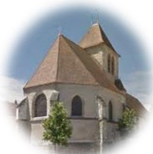
Saint-Etienne Mantes la Ville