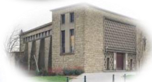
Sacré-Cœur Mantes la Ville