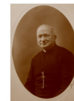
CONCEPTION ET DOCUMENTATION MARIE-CHRISTINE GOMEZ-GÉRAUD PATRIMOINE ET DÉCOUVERTES 2022