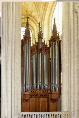
Le grand orgue (1897) Merklin III / P 37

Orgue restauré en 2013 avec des matériaux d'origine et des techniques du XIX ème siècle.