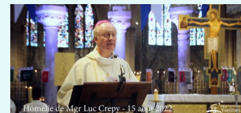
Homélie de Mgr Luc Crepy - 15 août 2022