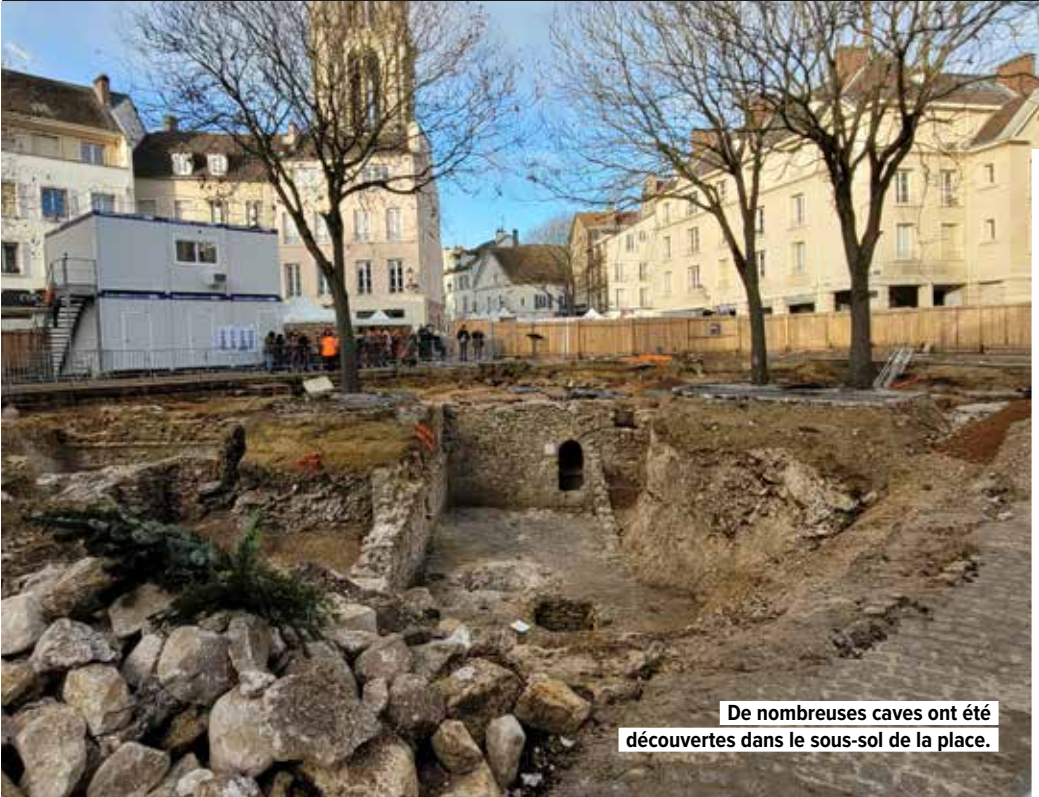
De nombreuses caves ont été découvertes dans le sous-sol de la place.