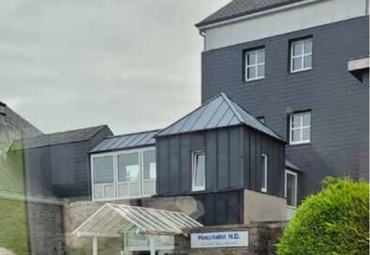
Un accueil chaleureux à l'Hospitalité de Banneux Notre-Dame.

POUR EN SAVOIR + https://fr.wikipedia.org/wiki/Banneux