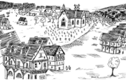
Évocation de l'église Saint-Maclou et son cimetière au XIII e siècle.

https://www.inrap.fr/de-l-archeologie-de-sauvetage-l-archeologie-preventive-9724