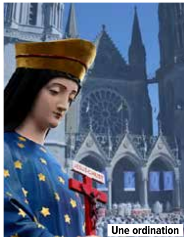
Une ordination sous la protection de Notre-Dame de Pontmain.