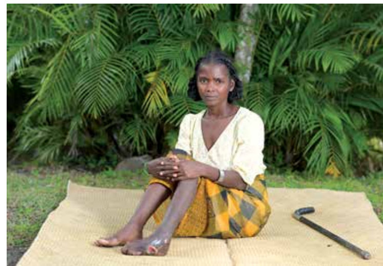
La stigmatisation qu'entraîne la maladie pousse les malades à se cacher, augmentant le risque de contagion pour leurs proches, et la progression irréversible de la maladie dans leur corps.