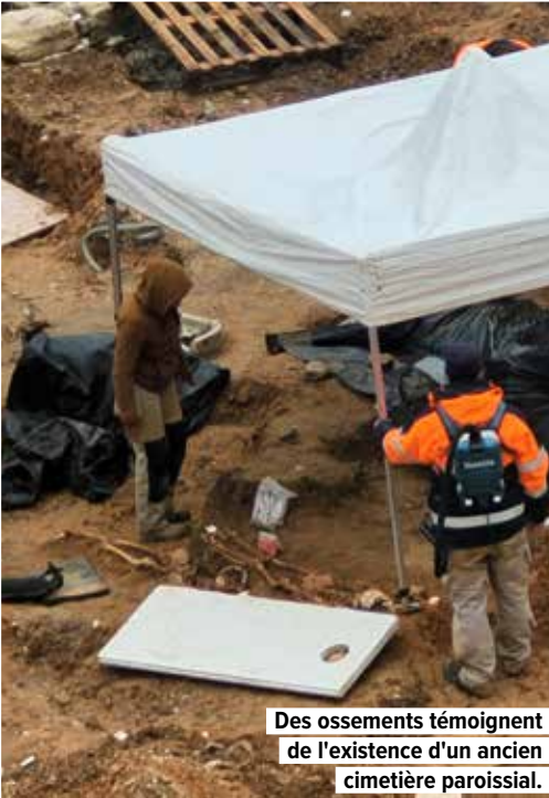
Des ossements témoignent de l'existence d'un ancien cimetière paroissial.

Depuis le mois de septembre 2023, en amont du projet d'aménagement des places du Coeur de Ville de Mantes-la-Jolie, des fouilles sont menées sur la Place Saint-Maclou.