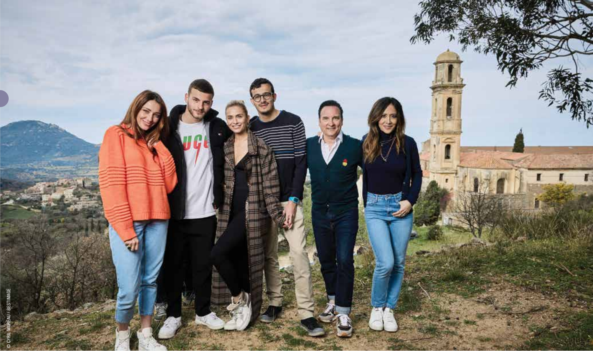
Les six célébrités qui ont participé au programme "Bienvenue au monastère", diffusé sur C8.