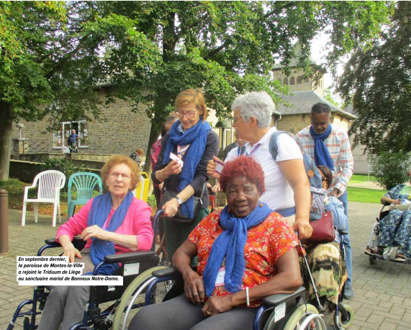
En septembre dernier, la paroisse de Mantes-la-Ville a rejoint le Triduum de Liège au sanctuaire marial de Banneux Notre-Dame.

« CROYEZ EN MOI ET JE CROIRAI EN VOUS » AVEC L'HOSPITALITÉ DE LIÈGE