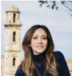
FABIENNE CARAT L'actrice bien connue de Plus belle la vie est aujourd'hui à l'affiche de son spectacle Née de père trop connu et bientôt sur TF1 dans Section de recherches . Elle sort son premier single Tous ces hommes .

La clé de tout, c'est de s'aimer soi-même et de se faire aimer comme on est. De s'accepter comme on est. Je me compare à La Belle au bois dormant car j'ai dû dormir très longtemps pour attendre mon prince charmant ! Quand on est aimé comme on est et qu'on n'a pas l'habitude car on est toujours critiquée, qu'on est habituée à se remettre en permanence en question, ça fait très bizarre !