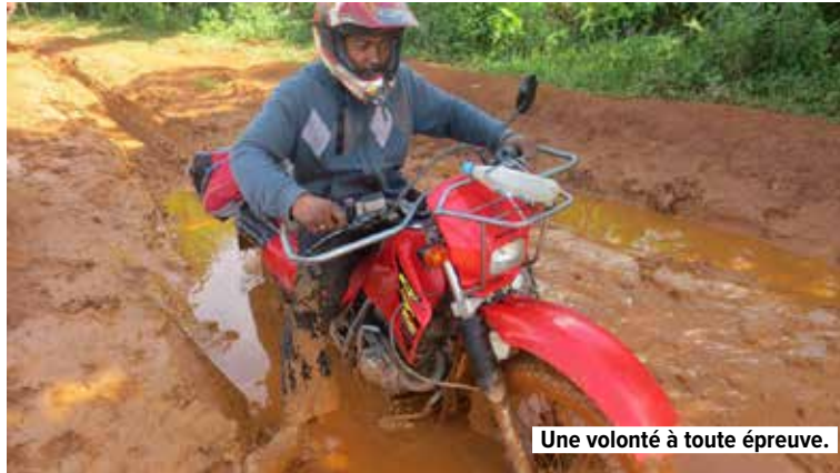
Une volonté à toute épreuve.