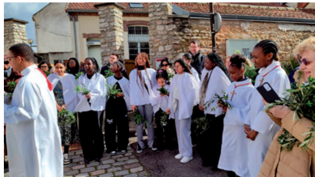
Servants, servantes d'autel et servantes de l'assemblée à Limay