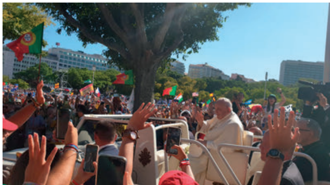
Le Pape François aux JMJ 2023 devant les jeunes de notre paroisse

Les messages du Pape aux jeunes portent généralement sur l'espérance, la foi, l'engagement et la fraternité. Voici un résumé de ses principales exhortations :