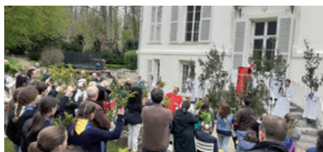
Rameaux à Sailly (13/04/2025)