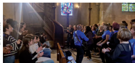
Gospel avec l'aumônerie à Limay (17/05/2025)