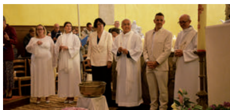
Veillée pascale à Follainville (19/04/2025)