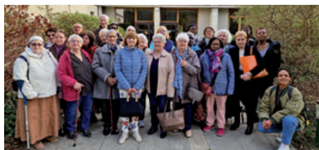
Rencontre du MCR à Poissy (25/03/2025)