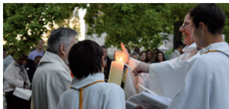
Cierge pascal à Follainville (19/04/2025)