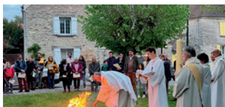
Feu pascal à Follainville (19/04/2025)