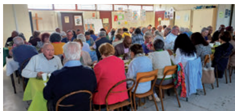
Repas du CCFD à Gargenville (06/04/2025)