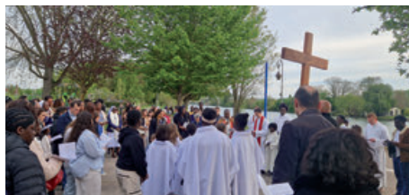
Chemin de Croix de Limay à Mantes (18/04/2025)