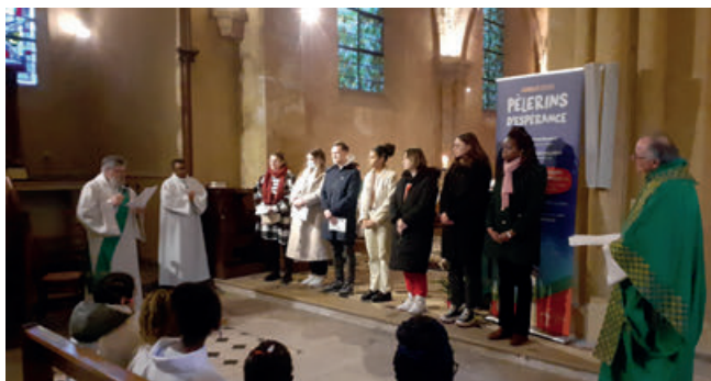
Entrée en catéchuménat à Limay