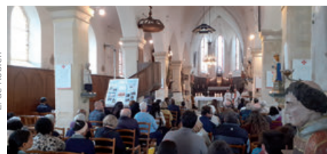
Messe de la fête paroissiale à Sailly (18/05/2025)