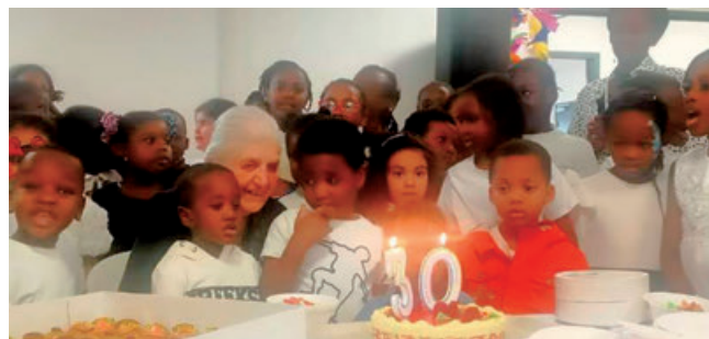
Paroisse de Mantes

Notre-Dame qui viennent chaque soir aider les enfants à faire leurs devoirs, participer à des jeux de société et jouer ensemble. Le but est que les enfants puissent comprendre le bien-vivre ensemble.