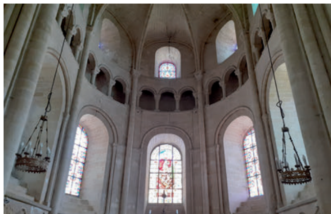
E. de Robien

À partir du XII ème siècle, l'église s'enrichit de nouveaux éléments dans le style gothique naissant. Le chœur, notamment, présente des voûtes d'ogives qui marquent une volonté de s'élever, tant symboliquement que techniquement.