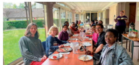
Les animateurs de l'aumônerie à Lisieux (10/05/2025)