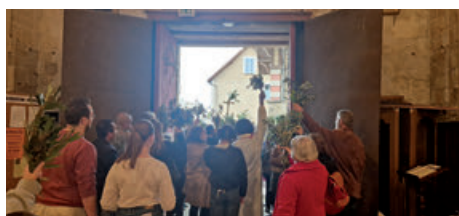
Rameaux à Juziers (13/04/2025)