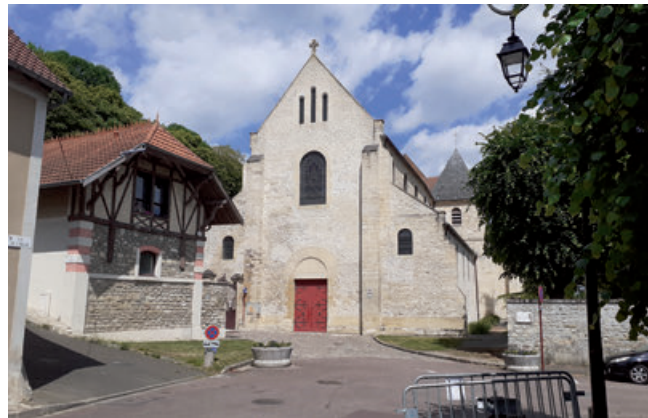
E. de Robien

Au XIX ème siècle, dans le sillage des grandes campagnes de restauration du patrimoine menées sous l'impulsion de Prosper Mérimée, l'église fait l'objet de soins attentifs. Les architectes Eugène Garrez, puis Antoine Godebœuf, supervisent des travaux qui consistent notamment à reconstruire la façade occidentale et à voûter la nef, alors restée à ciel ouvert.