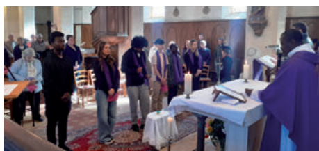
Scrutins des catéchumènes (aumônerie, Sailly) (06/04/2025)