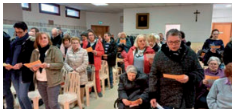
Réouverture de la chapelle Ste-Rita de Juziers (29/03/2025)