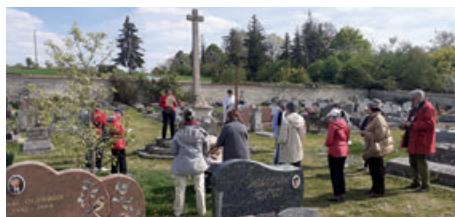
Chemin de Croix à Fontenay (18/04/2025)