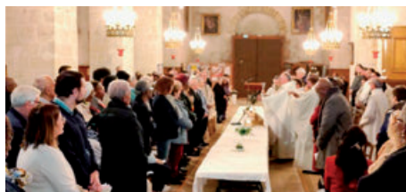
Jeudi Saint à Juziers (17/04/2025)