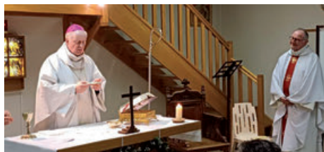
Réouverture de la chapelle Ste-Rita de Juziers (29/03/2025)