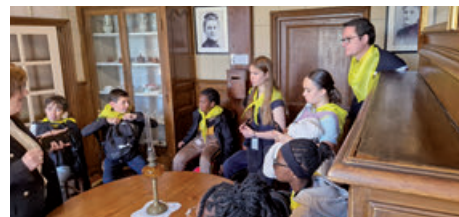
L'aumônerie visite les Buissonnets (10/05/2025)