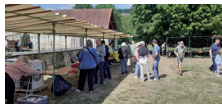
Kermesse paroissiale à Sailly (18/05/2025)