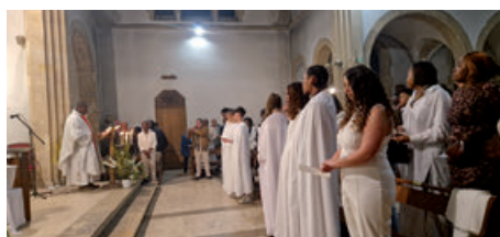
Veillée pascale à Gargenville (19/04/2025)