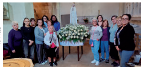
Notre-Dame de Fatima à Limay (11/05/2025)