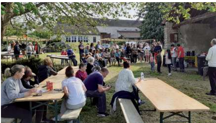
« Tirage de la tombola