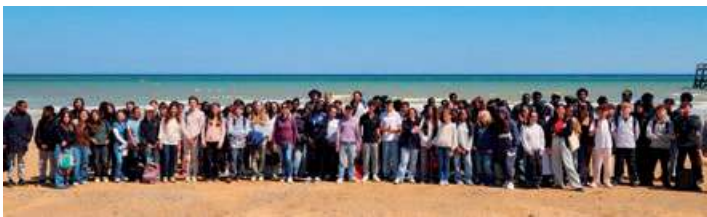
« Retraite de confirmation des jeunes de l'aumônerie »

Parce que de plus en plus d'adultes et d'adolescents frappent à la porte de nos paroisses pour demander le baptême, la communion et la confirmation. Et nous voulons rendre grâce pour ce don que Dieu fait à nos églises, pour ces « nouvelles pousses » ! Tel est le sens du mot « néophyte » qui est employé pour parler de ceux qui viennent d'être baptisés. Un concile c'est d'abord une célébration !