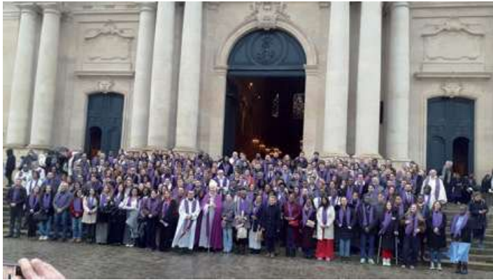
Appel des catéchumènes à Versailles (février 2026)

Le Concile provincial d'Île-de-France, ouvert le 25 janvier, marque une étape importante dans la réflexion pastorale de l'Église catholique en région parisienne. Placé sous le thème « Catéchumènes et néophytes, de nouvelles perspectives pour la vie de notre Église dans nos diocèses », il invite les communautés chrétiennes à se pencher sur la place croissante des adultes qui demandent aujourd'hui les sacrements de l'initiation chrétienne.