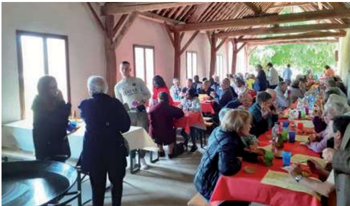
Repas de la kermesse à Sailly