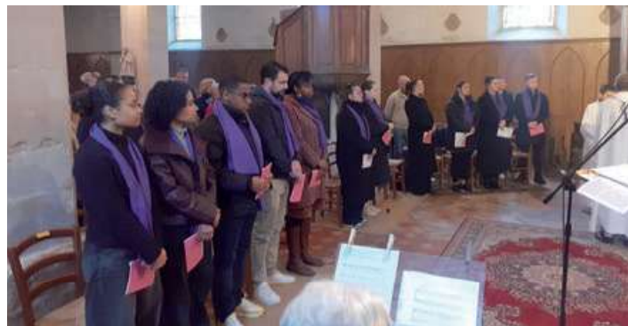
2 ème étape (scrutins) vers le baptême (mars 2026)

proposé au jour le jour, il y a cette participation à des groupes mais aussi aider, donner des coups de main ici ou là... Ils se sentent utiles, et ça leur fait du bien. Ils se sentent en importance.