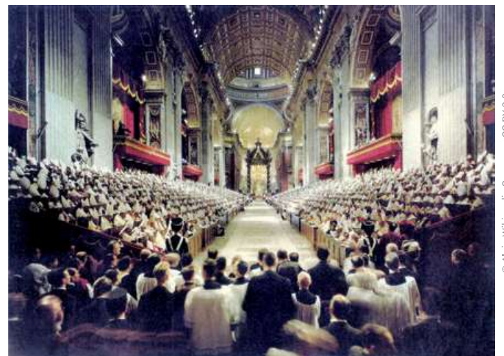
Ouverture du Concile Vatican II à Rome

Plus récemment, le concile Vatican II (1962-1965) a marqué profondément la vie de l'Église contemporaine, en soulignant l'importance de la Parole de Dieu, de la liturgie, du dialogue avec le monde et de la mission de tous les baptisés.