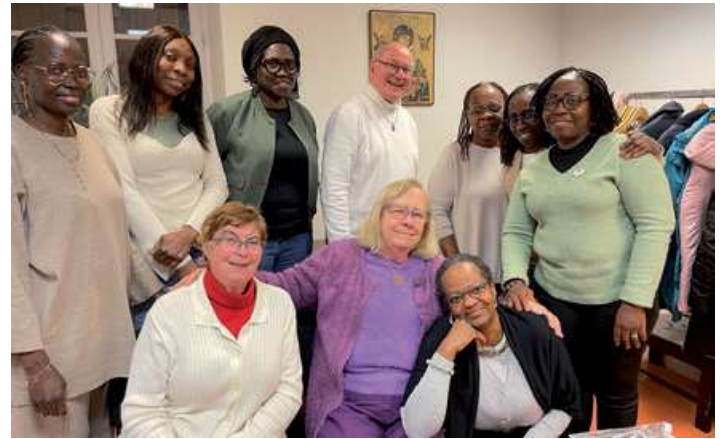
Réunion des soignants à Limay

Réunion des soignants à Limay en février 2026