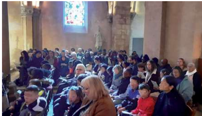
Messe dans l'église de Limay

les jeunes se sentent intégrés. Chacun a son histoire... Nous, dans l'accueil, on peut toujours mieux faire. Mais ce que je vois c'est que des gens nouveaux viennent de plus en plus régulièrement, il y a de nouvelles têtes mais qui reviennent ! Jusqu'ici les gens venaient surtout pour les grandes fêtes (ma première lecture je l'ai faite il y a trois ans, le jour de Pâques, il y avait 300 personnes dans l'église de Limay, contre 100 d'ordinaire !).