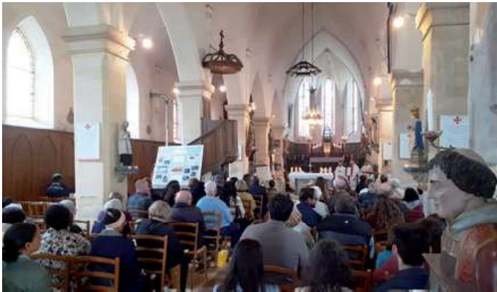
Messe de la kermesse à Sailly