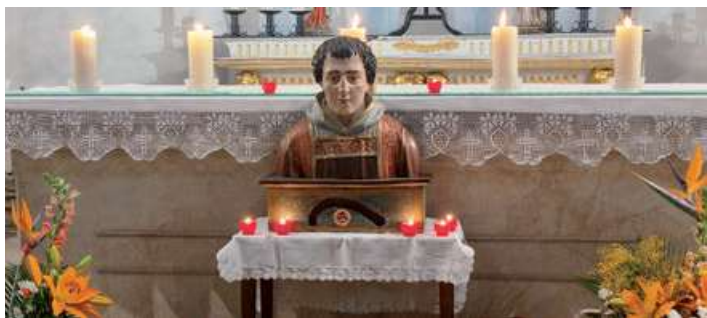
Reliquaire de saint Gaucher à Gargenville