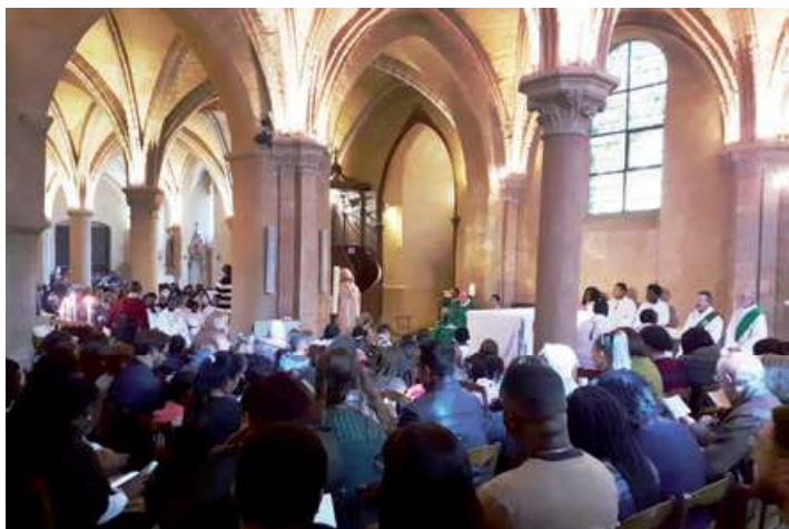
Messe des familles à Limay

Les jeunes qui entrent dans le cheminement des sacrements et de la vie de chrétien ont une réelle implication, ils ne vont pas faire une apparition puis disparaître : ils participent, cherchent à se rendre utiles. En tant que lecteur liturgique, je vois qu'il y a de plus en plus de jeunes. Avant, le groupe de lecteurs était composé surtout de femmes, et de personnes avec une certaine expérience. Cela évolue avec de plus en plus d'implication de jeunes. Récemment, deux nouvelles jeunes femmes se sont ajoutées au groupe. J'apprécie le fait qu'il y ait de nouveaux visages, ça apporte une certaine fraîcheur, et la rotation sera plus régulière dans notre organisation de lecture.