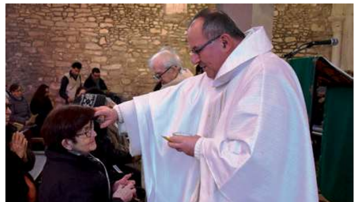
Sacrement des malades à Fontenay

Tout au long de sa mission, Jésus n'a jamais cessé de manifester son attention et sa proximité aux malades, les accueillant inlassablement, accomplissant pour beaucoup des guérisons miraculeuses. Il est le signe de la compassion de Dieu pour ceux qui souffrent, et de sa volonté de sauver l'Homme du mal sous toutes ses formes.