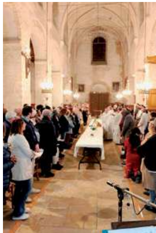
Messe du Jeudi Saint à Juziers

Nous sommes arrivés à Juziers il y a un an. Avant cela, nous vivions dans une grande ville et avions l'habitude d'aller à la messe tous les dimanches. En arrivant ici, nous ne savions pas encore qu'il existait une rotation des messes entre les différentes églises du groupement paroissial de Limay.